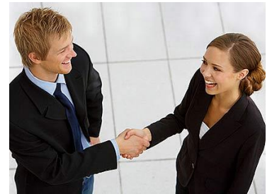
Eine freundliche Begrüssung führt zu erfolgreichen Gesprächen.

Schlimmstenfalls wird ein Kauf abgelehnt. Dann gilt es, sich trotzdem freundlich zu verabschieden und allenfalls auf ein späteres Geschäft oder einen weiteren Beratungstermin zu verweisen.