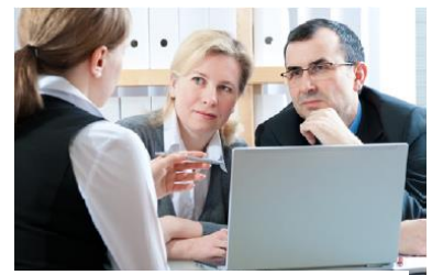
Achten Sie auf die Kleidung, die Körperhaltung, die Mimik und den Blickkontakt – und hören Sie gut zu.